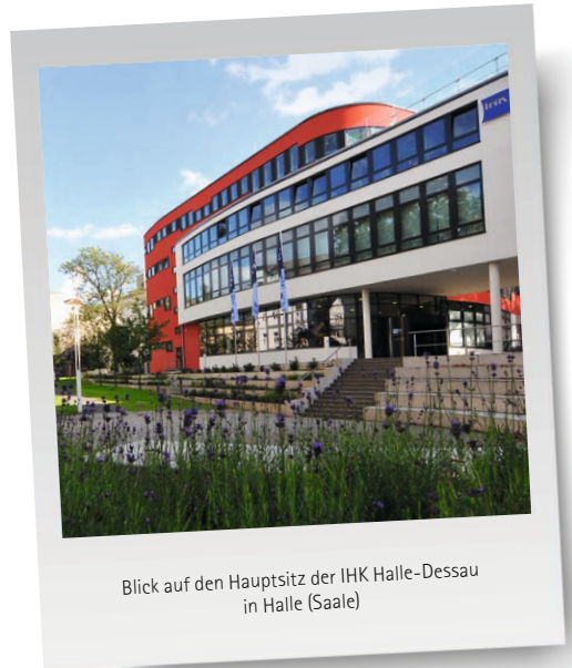
Blick auf den Hauptsitz der IHK Halle-Dessau in Halle (Saale)

Die kommende Legislaturperiode ist von großer Bedeutung, stehen doch Weichenstellungen in vielen Bereichen an. Eine „Schonfrist“ kann sich das Land angesichts von Fachkräftemangel, Investitionsschwäche und internationalem Standortwettbewerb nicht leisten. Es gilt, die vorhandenen Potenziale konsequent zu heben und die strukturellen Weichen so zu stellen, dass Sachsen-Anhalt als Wirtschaftsregion stark, innovativ und weltoffen bleibt.