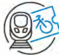
AF5 Parkraummanagement und Komplementärmaßnahmen