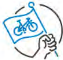
AF1 Information Kommunikation Motivation