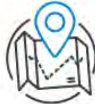
AF2 Koordination/ Organisation